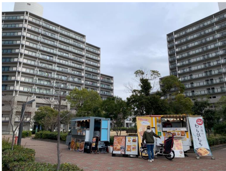
(現在の出店の様子)

実証実験により、多くの方にご利用いただき、高い満足度が得られたことから、2021年4月から半年間のモデル実施を経て、2022年1月からは地元車を介さずに公社と事業者との直接契約による本格実施に移行しました。