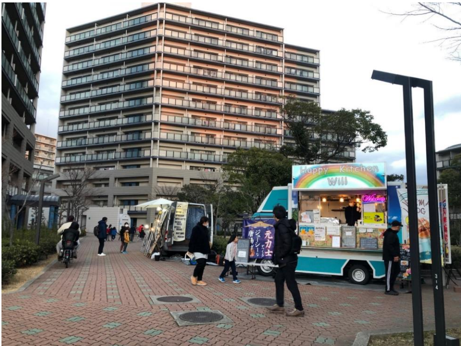
(社会実験時の出店の様子)

コロナ禍で自宅で食事する機会が増え、惣菜購入やデリバリー等を利用する“中食”需要の増加やイベント中止等による住民同士の集う機会の減少に対応するため、団地の敷地内にキッチンカーを誘致し、ウィズコロナ時代の新しい生活様式に対応した付加サービスとしての有効性を検証しました。