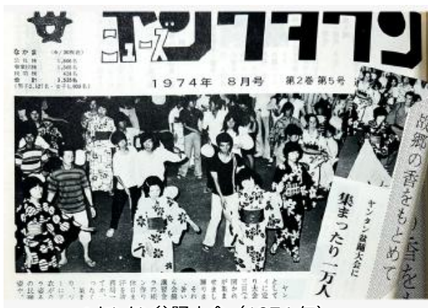
▲ヤンタン盆踊大会（1974年）

最盛期には 60 近いクラブが存在したと言われるほど、ヤングタウンでのクラブ活動は活発に行われ、入居者自らが企画・運営を行っていました。