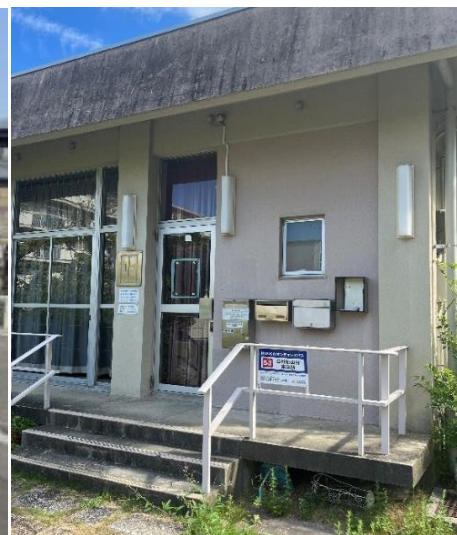
△バス停留所（原山台団地）

※1）AI オンデマンドバスとは、時刻表や決まった運行経路がない小型の乗合バス（客席8席）です。あらかじめ設定した運行エリア内に停留所を配置し、利用者の予約に応じてAI（人工知能）を活用して効率的な配車を行う輸送サービスで、利便性向上や高齢者の外出促進が期待されています。