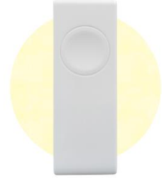
振動センサデバイス