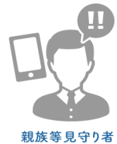
▲公社のみまもり『ミマリオ』のしくみ（イメージ）