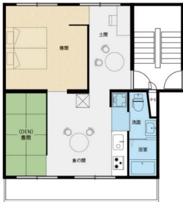
▲「リノベ45」 土間でつながる家 間取り