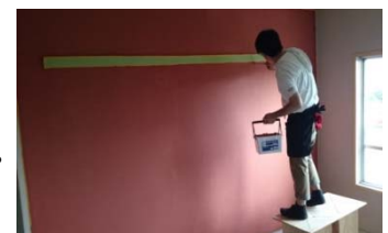
壁の塗装替え作業イメージ

壁や天井の塗装替えやクロス張替え、木部への釘・ビス打ち、床のクッションシート張替え、手すりの設置など、多彩な DIY メニューをご用意しています。