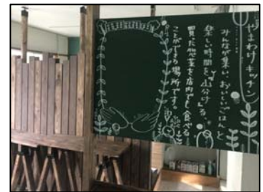
惣菜販売コーナー