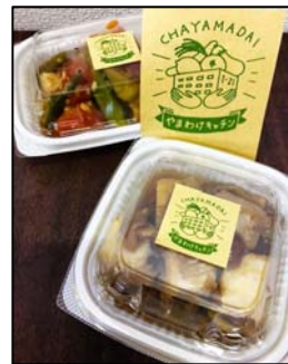
泉北産の食材等を使い 管理栄養士が考えた 惣菜一品100円～

開設：2018年11月5日（月） 営業時間：11時～15時（月・火・金・土曜日） 運営者：NPO法人 サイン SEIN