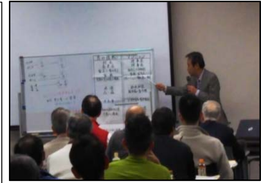
過去のセミナーの様子

大阪府内の分譲マンションにおける日常の管理運営から修繕や改修、建替えなど幅広い管理組合活動を支援しています。 大阪府が中心となり、23の市町、専門機関等の関係団体で構成されています。