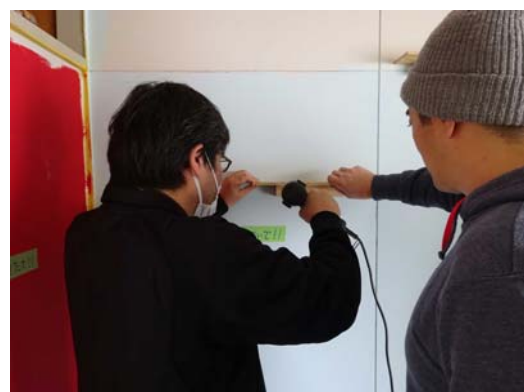
2017年2月に実施した第1弾DIY体験イベント in 香里三井C団地（大阪府寝屋川市）の様子