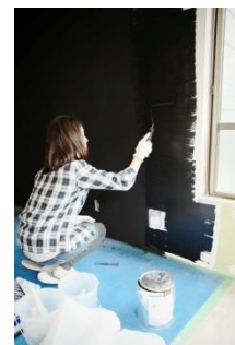
DIY 作業風景（イメージ）