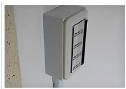
スイッチプレートの取替え