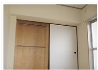
クローゼット化(ハンガーパイプ設置)