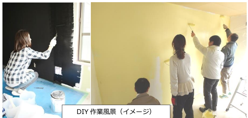
DIY作業風景（イメージ）

そこで、居住者の多様なニーズに対応することで新規入居者の促進を図るとともに、既存入居者の長期入居を見込み、入居者が自由に模様替えできる「団地カスタマイズ」を導入することといたしました。