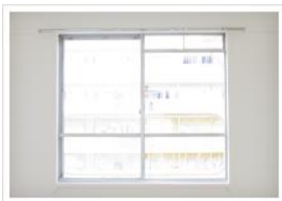
カーテンレールの取替え