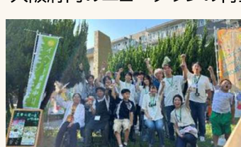
地域コミュニティの活性化