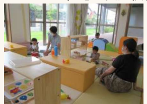
子育てしやすい住宅環境の整備