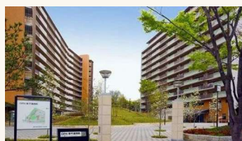
大阪府内のニュータウンの再生