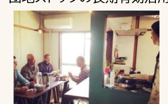
高齢者の孤食防止の推進