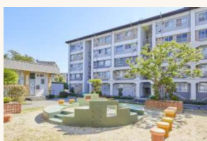
アフォーダブル住宅の安定供給