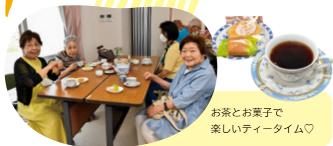
お茶とお菓子で 楽しいティータイム♡