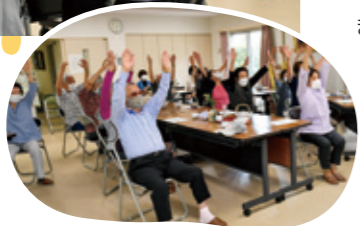
座ったままで できる体操も

この日、最初に行われたのは千里中央病院の理学療法士によるお話。フレイル(身体的機能や認知機能の低下が見られる状態のこと)予防のための簡単な体操を交えるなど、テンポよく進められます。ティータイムにはおやつとコーヒーが配られ、談笑を楽しむ姿も。後半には高座が設けられ、2人の落語家が登場。どっと笑いに包まれる場面もあり、皆さん楽しんでいる様子が伝わってきます。最後、会を締めくくるのはマジック。巧みな技の数々に一同、拍手!まばたきもせず、食い入るように見る皆さんの姿が印象的でした。