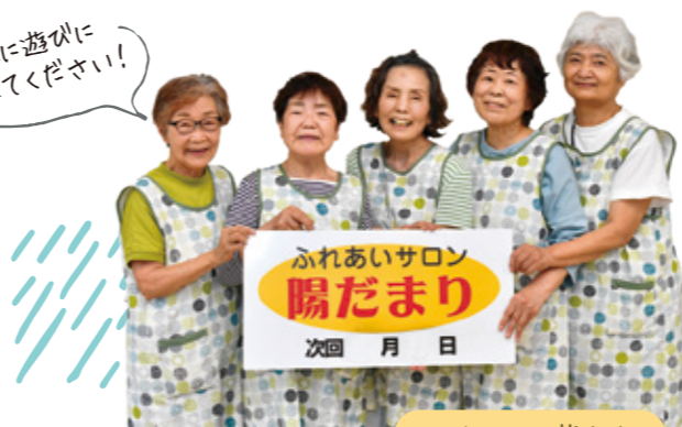
スタッフの皆さん

便宜上、役割分担はあるのですが、基本的に5人の上下関係はなく、対等な立場で役割を果たしています。参加者は高齢の方が中心なので、事故や感染症対策には細心の注意を払っています。お茶の入れ方ひとつでも、5人で取り決めをするなど、なれ合いになることなく、基本的なことを大切にしてきたからこそ、こうして継続でき皆さんに喜んでいただけているのだと自負しています。