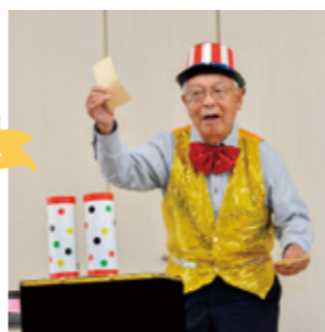
紙切れが 千円札に?!