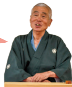
お後が よろしいほうで...

ここ、OPH新千里南町で「陽だまり」の集いが始まったのは、東日本大震災の翌年のこと。もしも、大きな災害が起こったら?と、近所同士のつながりが希薄化していることに危機感を覚え、平常時から顔見知りを増やしておくことが精神的な安心感につながるのでは、と考えた有志の6人が立ち上がりました。「最初は、「お遊び」としか思われていなかったのよ」という集いも、会を重ねて実績や活動内容が認められ、自治会や、南丘校区福祉委員会などから助成金をもらえるほどに。