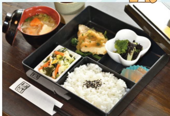
栄養士が監修する日替わりランチは500円でわらび餅のデザート付き。やさしい味付けが人気です。