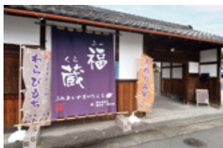
原山台団地から徒歩約15～20分