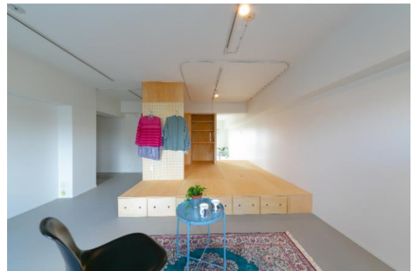
▲『リノベ 55』千里山田西団地の住戸内