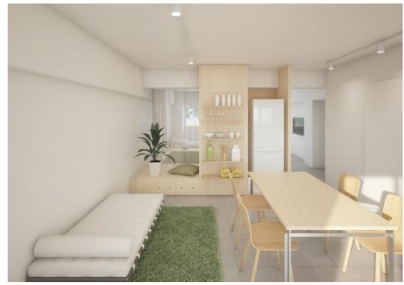
▲『リノベ55』住戸内写真