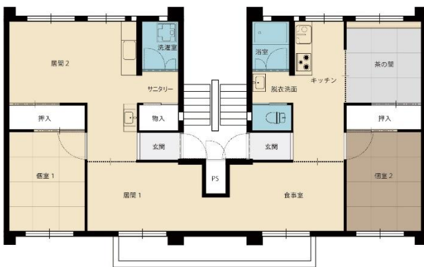
▲『ニコイチ』香里三井 B 団地の間取り

大阪府内で賃貸住宅の提供などの事業を行う大阪府住宅供給公社（本社：大阪府中央区、理事長：堤 勇二、以下、公社）は、香里三井団地・香里三井 B 団地（寝屋川市）で隣り合わせの 2 戸を 1 戸に繋げる団地リノベーション『ニコイチ』と、千里山田西団地（吹田市）で各自のライフスタイルに適した間取りに自由に變更できることをコンセプトにした団地リノベーション『リノベ 55』の現地オープンルーム・入居申込受付会を 4 月 20 日（土）、21 日（日）に開催します。