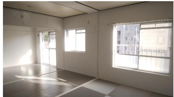
▲『ニコイチ』住戸内写真