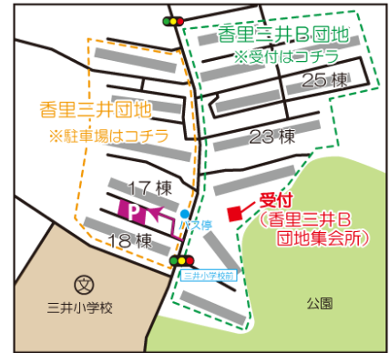
香里三井 B 団地 アクセス地図