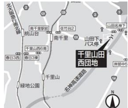
千里山田西団地 アクセス地図