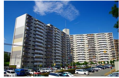
千里山田西団地 外観