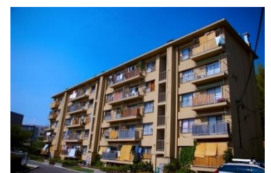
香里三井 B 団地 外観