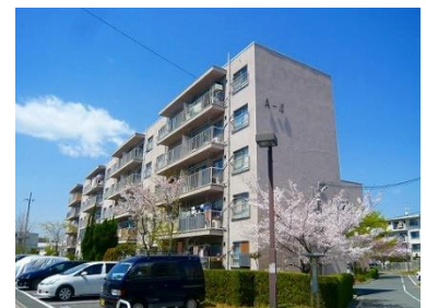
香里三井団地 外観