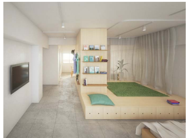
室内のイメージパース