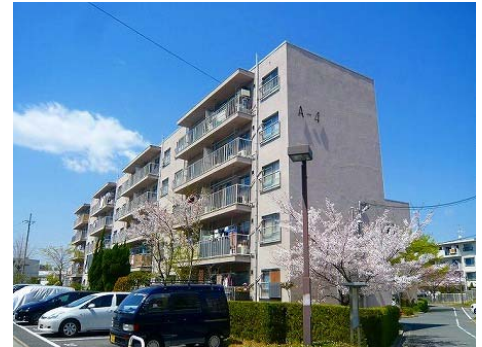
香里三井団地 外観

所在地 : 寝屋川市三井が丘1丁目1番 総戸数 : 340戸 構造 : 鉄筋コンクリート造5階建 住戸専有面積 : 44.58 m 2 入居開始 : 1969年（昭和44年）2月 交通 : 京阪本線「香里園」駅よりバス約12分 「三井団地」バス停より徒歩約1分