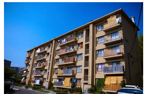
香里三井B団地 外観

所在地 : 寝屋川市三井が丘1丁目9番 総戸数 : 258戸 構造 : 鉄筋コンクリート造5階建 住戸専有面積 : 44.98 m 2 ～45.11m 2 入居開始 : 1969年（昭和44年）8月 交通 : 京阪本線「香里園」駅よりバス約12分 「三井団地」バス停より徒歩約1分