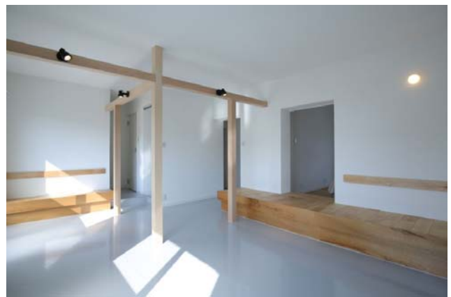
2017年度に茶山台団地で実施した2戸1化リノベーション住戸の一例