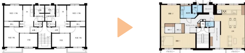
2017年度に茶山台団地で実施した2戸1化リノベーションプランの間取り図（一例）

今年度は堺市南区にある茶山台団地と、今回、事業提案競技の参加者を募集する寝屋川市にある香里三井団地・香里三井 B 団地で『ニコイチ』を実施します。