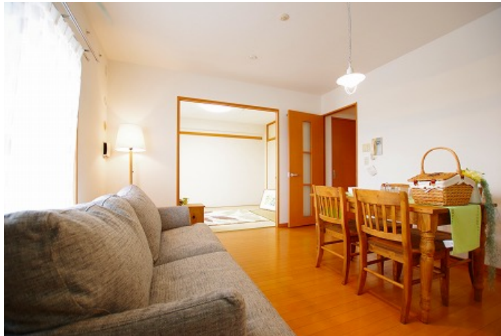
OPH 杉本町（大阪市住吉区）。新婚・子育て世帯は3年間最大72万円のキャッシュバック！