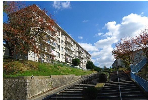
ウェディングの舞台となる団地内の大階段