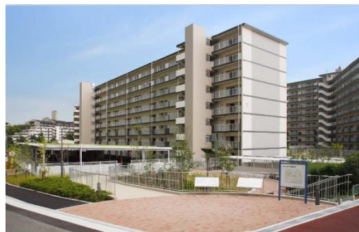
▲ 建替事業により建設された団地(OPH新千里南町)

これまで築き上げた住宅、団地という貴重な社会的資産と管理についての実績のもと、豊富な知識と経験を活かし、公的機関としての信頼に応え得る規律と熱意をもって、府民、地域に対し、「住んでみたい」「住み続けたい」安全・安心で快適な住まいと住環境の提供をめざします。