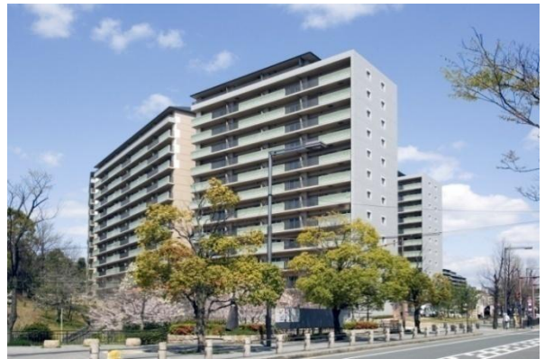
▲ 建替事業により建設された団地(OPH新千里西町)

府内の分譲マンションにおいて、管理組合などが取り組む大規模修繕、建替えなどを中心とする活動を支援するため、大阪府分譲マンション管理・建替えサポートシステム推進協議会の窓口となり、管理組合の取り組みを支援しています。