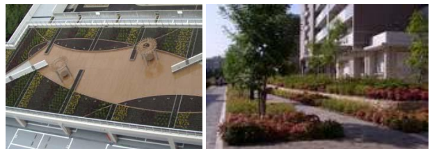
▲ 緑化への取組事例(OPH千里佐竹台) ・駐車場の屋上緑化(左) ・沿道の高木と遊歩道による緑地帯(右)