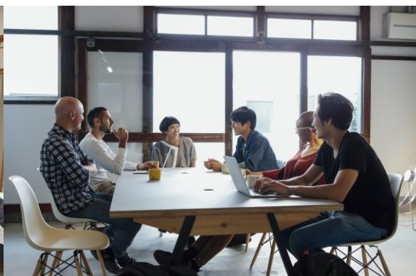
△多文化交流イベントのイメージ