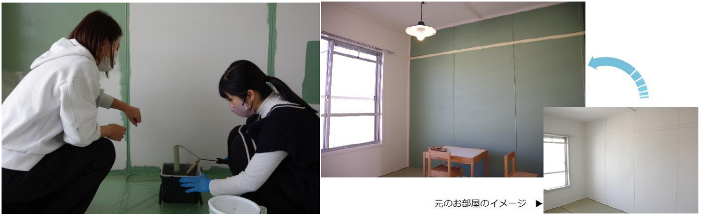
△過去のつくろう家 Basic レクチャープランの様子