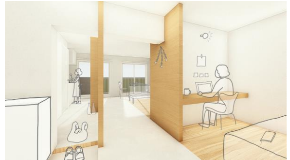
△イメージパース(Aタイプ)

当作品では、空間が広く感じられるところ、空調が効きづらい場所には大容量の収納として機能的に活用されている点、バルコニーに面して明るく広いリビングが配置されている点などが評価されました。