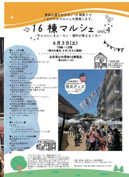
△今年の告知チラシ