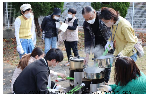
△学生と住民の共同イベント(2022年)

『ニコニコのデザイン』プロジェクトは、国土交通省の「人生100年時代を支える住まい環境整備モデル事業」（※）に選定されています。当プロジェクトでは、地域にお住まいの方の笑顔に溢れる団地づくりを目指し、学生のアイデアを活かしたイベント開催やフィールドワーク、アンケート調査等を行うとともに、多世代交流拠点づくりへと発展させていきます。