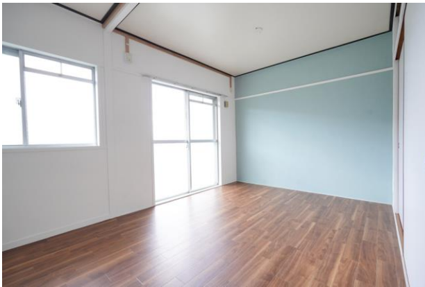
△室内イメージ（香里三井団地 2LDK）