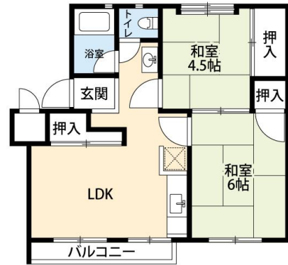
△間取り一例（香里三井団地 2LDK）