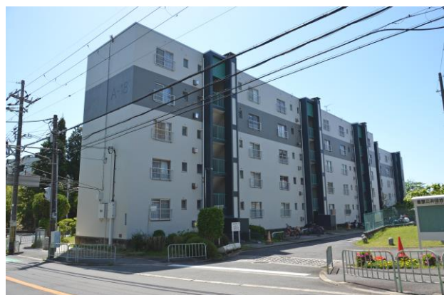
△外観（香里三井団地）