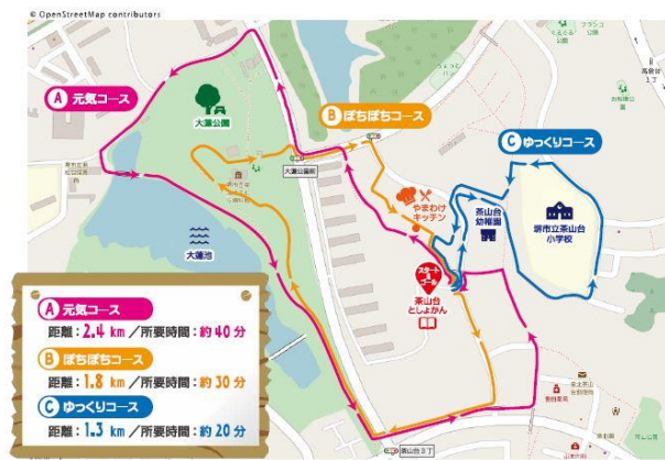
△「ちややあるき」プログラム