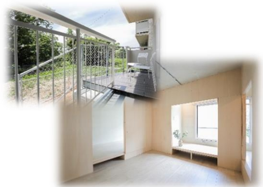
△庭つき『リノバ45』 庭を楽しむ一戸建てのような家