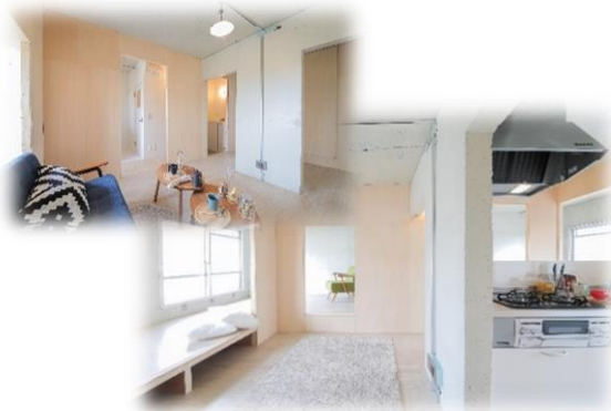
△タテつながり『ニコイチ』 上下階をアクティブに暮らす家

大阪府内において公社賃貸住宅 SMALIO（スマリオ）を提供する大阪府住宅供給公社（本社：大阪市中央区、理事長：山下 久佳、「以下、公社」）は、茶山台団地（堺市南区）で施工した子育て世帯など若年層の多様なニーズへの対応とデザイン性を兼ね備えたリノベーション住戸について、6月28日（月）から入居者募集を開始します。また、6月26日（土）、27日（日）にオープンルームを実施しますので、お知らせします。