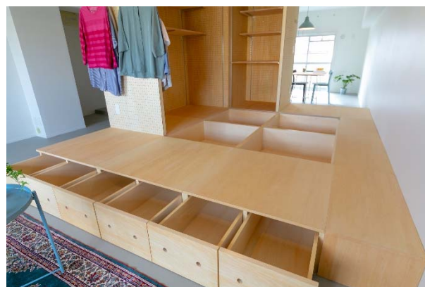
2019年1月に完成したばかりの団地リノベーション『リノベ 55』。 『シマ』には大容量の床下収納スペースがあります。