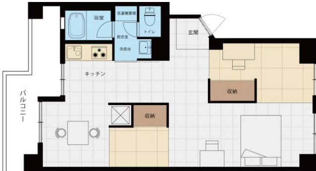
Type-A1 2LDK フレックス

住まう人が自ら、各自のライフスタイルに適した間取りに自由に変えていただくことをコンセプトにした、これまでにない全く新しい間取りプランです。