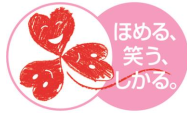
大阪「こころの再生」府民運動 ～大阪あったかプロジェクト～

大人も子どもも忘れてはならない大切な「こころ」をもう一度見つめ直し、府民一人ひとりが身近な取組みを実践することを呼びかける運動です。次代を担う子どもたちの豊かな人間性を育むために、家庭、学校、地域、企業等社会全体で、子どもの「こころ」を信じ、守り、育て、鍛える取組みを行っています。