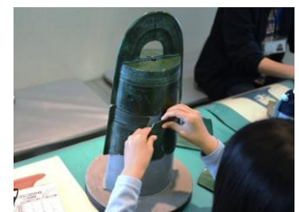
銅鐸パズルの様子

今回は、「ハーベストの丘」に、弥生文化全般を広く対象とする全国で唯一の博物館「弥生文化博物館」がやってきます。普段目にすることができない土器や銅鐸(ドウタク)を複製した立体パズルを考古学者気分で見立てることができ、子ども達に日本の歴史文化を体感してもらいます。