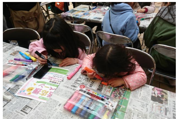
以前実施したイベントの様子

公社は、子育て世帯向けにリノベーションした住戸の提供や、 新婚・子育て世帯向けの家賃補助・優先申込期間制度 により、子育て世帯の豊かな暮らしをサポートしています。また、『大阪「こころの再生」府民運動』のパートナー企業として、 “子どものこころ”と“地域の子育て力”を育むため 、親子で楽しめるワークショップと公社賃貸住宅の子育て世帯支援制度を紹介するイベントを大阪府内各地で行っています。