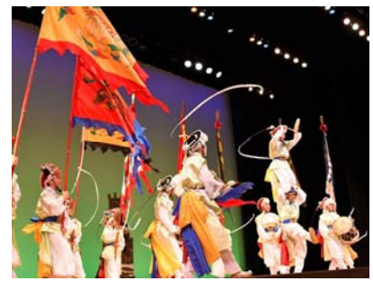
韓国伝統舞踊・チャンゴ