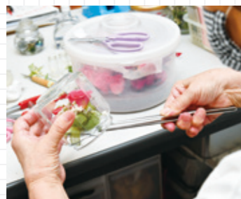
ボトルに閉じ込めると完成