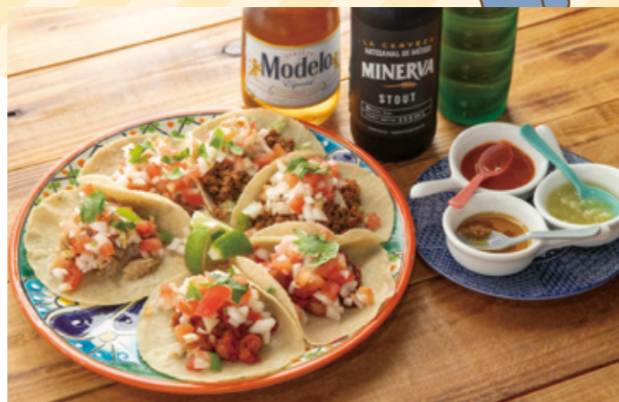
人気のタコス盛り合わせは3種類のタコスが2個ずつ、ソースは3種類から選べる。