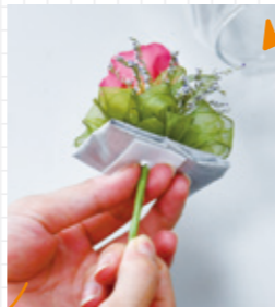
ひとまとめにしたワイヤーをシリカゲルを入れた台座にさして固定し、