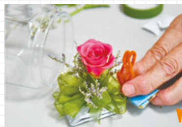
入れたいボトルの大きさを確認しながらバランスを調整して