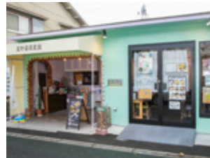
星田団地から徒歩約10分